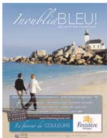
ANNONCE PRESSE "PARIS MATCH"

Cette campagne se traduit sur le web par la mise en ligne d'un jeu-concours du 17 mars au 15 mai permettant de gagner de multiples séjours en Finistère. Des achats de liens sponsorisés seront également opérés de mars à juin.